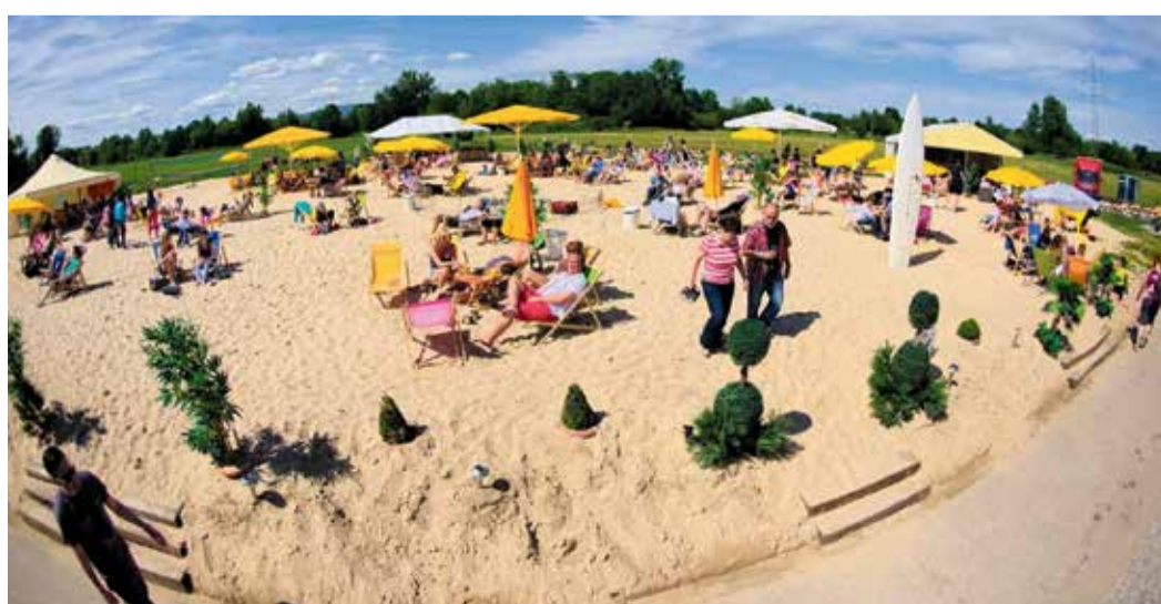
Weil Frankfurt manchmal einfach Urlaub braucht – und Nied das weiß.