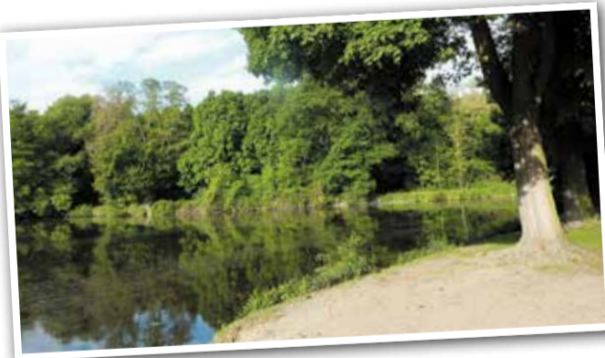
Nieds stilles Hinterzimmer, direkt vor der Haustür.

Karibik klingt groß. Aber wenn man an einem Sommerabend am Niddastrand sitzt, Sand un-