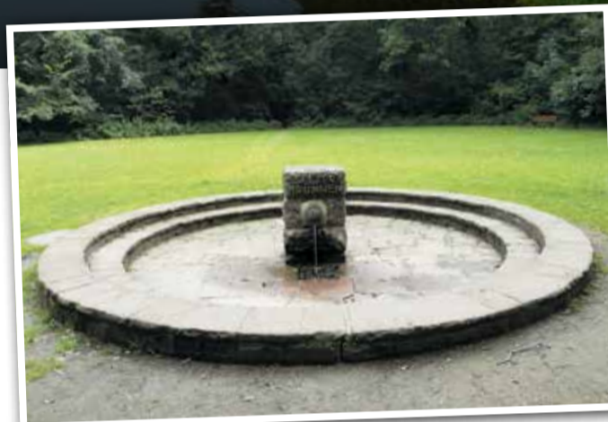
Der Selzerbrunnen im Niedwald.