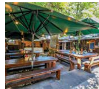
Der Biergarten des Holzkopp ist im Sommer keine Option, sondern Pflicht.

An der Wörthspitze beginnt der Frankfurter Grüngürtel. Das klingt nach Verwaltungsgeografie – ist aber eigentlich ziemlich beeindruckend. Wo Nidda und Main zusammenkommen, liegt eine langgestreckte Halbinsel: Rasenfläche, Liegewiese, Hundeauslauf, und ein Stück Frankfurt, das für einen Moment so